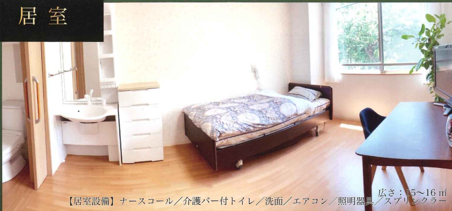
【居室設備】 ナースコール／介護バー付トイレ／洗面／エアコン／照明器具／スプリンクラー 広さ：15～16㎡