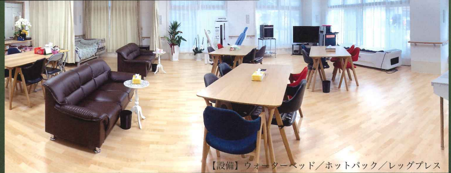
【設備】 ウォーターベッド／ホットパック／レッグプレス